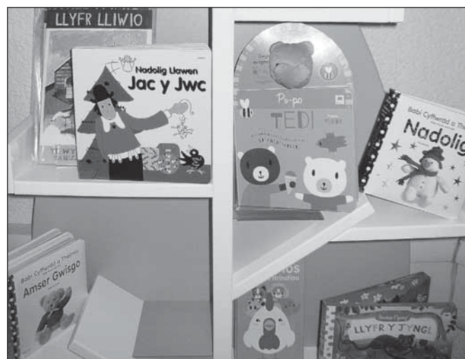
Žišece knigły we waliziskej rěcy

Smy na našej jězbje póbyli na rozdžělných městnach a se rozgranjali ze zagronitymi wšakich wobłukow. Wšykne su nam wjelgin wěcywustojnje rozkładowali, kak wóni žěłaju za woplěwanje rěcy, na pš. w Rěcnem centrumje, w komunje, w žiwadle abo w parlamense. Teke jich plan napšawow smy do rukow dostali a směli sobu wzeć. Našo pitšku zawidne glědanje na jich situaciju su wugładkowali z argumentom, až skóro pěšzaset