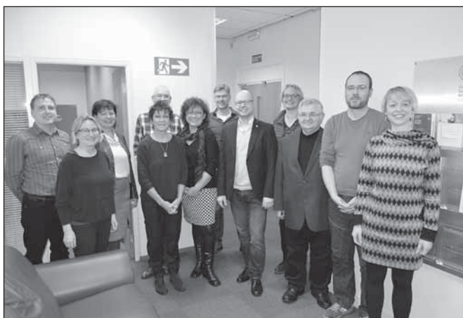
Wobžělniki jězby do Waliziskeje

Som wjelgin źěkowna, až som směła se wobželić a zastupować Rěcny centrum WITAJ na 4-dnjowskej studijnej jězbje k waliziskej mjeńšynje w decembrje zachadnego lěta. Njejo njeznate, až waliziske procowanja wó zdžaržanje rěcy su wjelgin wuspěšne. A togodla jo Domowina – Zwězk Łužyskich Serbow z. t. organizěrowała studijnu ekskursiju za zastupnikow wšakorakich serbskich institucijow do Waliziskeje, aby se na městnje informěrowali wó etniskem połoženju toho keltiskego luda. Južo pši přednem drogowanju wót lětanišća do hotela jo nam nadpadnuło, až su wšykne drogowniki konsekwentje dwójorěcnje wutoflowane, což jo se pótom teke na wšykných drugich městnach pokazało. Gaž žo wó nałożowanje wustneje rěcy su wóne bratšy a sošy