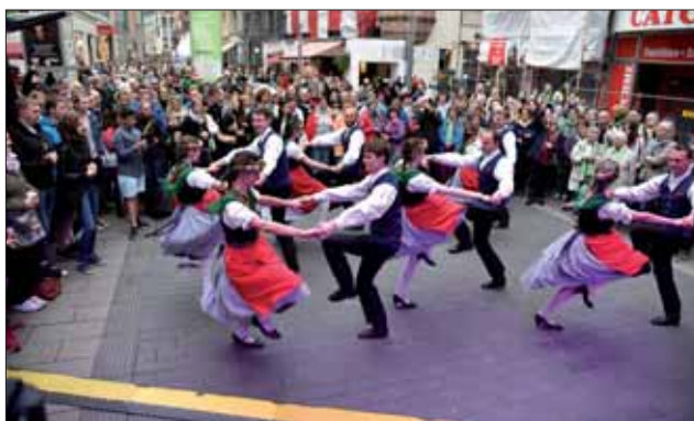
Wustup SmjerdŒeċan rejuwaneke skupiny na Dnju katolikow w Lipsku

Domowina ma pěstowanje naboŒno-narodnych tradicijow a nałŒkow za waŒne pšĳi wutworjenju, skrućenju a wuwibanju narodneho wědomja. Jedna so wo nadawki, kotreŒ podpěruja ċŏnske kaŒ teŒ zwonkaċŏnske cyłki.