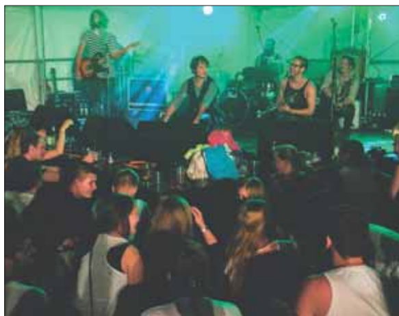
Skupina „Roy de Roy“ zahori mjezynarodnu młodžinu na Diversity festivalu w Radworju

W štyrjoch kreatiwnych dźělowych skupinach zaběrachu so wobdźělnicy z temami diskriminacija, trajna skutkownosć, interkulturelnosć a interkulturalita.