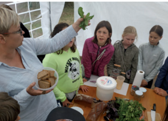
W jubilejnym lěće Zejlerja a Kocora zaběrachu so šulerjo z wuznamnymaj Serbomaj