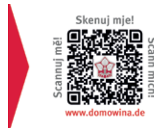
Zběrka serbskich póručenjow za šule

Pšistup k starjejšym w Dolnej Łužycy pšez akterow na městnje abo zeznaše z cłonkami serbskego familijowego towaristwa „Gromaže“ w Dolnej Łužycy njejstěj se hyšći tak ražiłej. Regionalny běrow Chóšebuz znajo a pódpěrujo Serbske familijowe towaristwo GROMAŽE w projektach, n. pš. “Małe jatšy”.