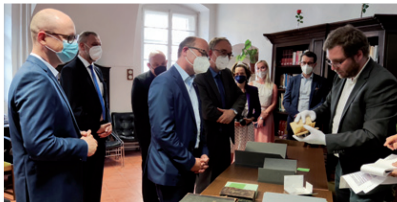
Předstajenje mjezywuslědka restawrowanja wobškodženych knihow we Łužiskim seminarje w Praze šefej Sakskeje Statnjeje kenclije w decembrje 2021 | foto: Clemens Škoda

Do župy Jakub Lorenc-Zalěski z.t. su pšistupili: