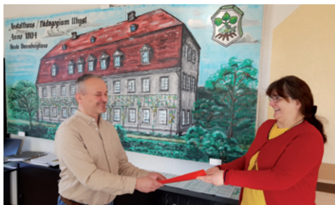
Přepodaće próstwy ZAHRODKI 1921 z. t. za přiwzaće do župy “Handrij Zejler” 10.03.2021