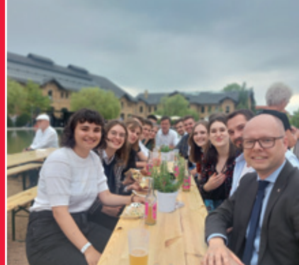
Tež to je spěchowanje dorosta: Rozmołwa před-sydy z redaktorkami a redaktori młodžinskeho wusyłanja “Satkula” składnostnje 30-lětneho jubileja sčelaka MDR w Lipskum

Domowina wudawa pšawidłownje informaciske łopjeno “Domowinske pokazki” za cełe cłonkojstwo Domowiny (online, E-mail, wokolnik a šišćane wudaše).