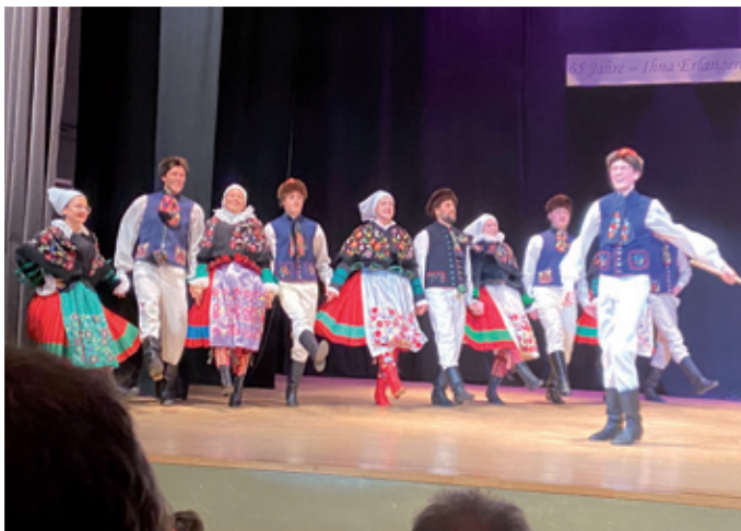
Domowina koordinowaše wobdźělenje serbskich čłonskich cytkow na hłownej zhromadźiznje CIOFF w oktobrje 2022 w Erlangen