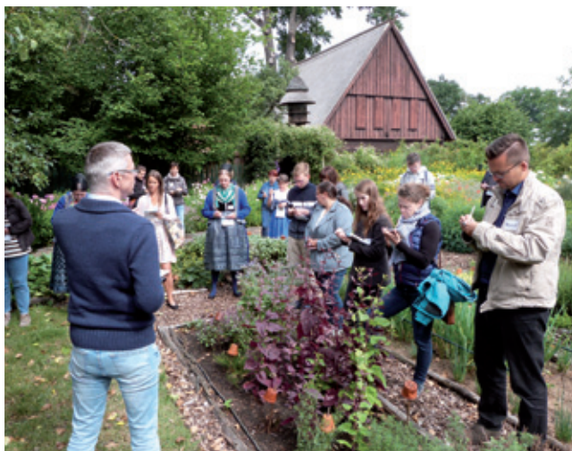
Wulět serbsce wuknjacych kursistow na Hory a do Wojerec w lěću 2022

Wulki džěl nadžěłanych wučbnicow, džětowych zešiwkow, słownikow a přiručkow wopřija tež přidatne poskitki kaž aplikacije za šulerjow a wučerjow, wučerske doporučenja, hrajne plany z nawodom k wužiwanju abo DVD z wuknjenskeje software. Tež awdijo-CDki so wudadža, kaž za wučbnicowy rjad “Wuknjemy serbsce” za serbšćinu jako cuza rěč abo za serbšćinu za rěčnu skupinu z we wučbnym rjedže “Serbšćina”. Dalši poskitk su słuchoknihi kaž k bajkowej knize “Čerwjewawka a druhe bajki” a to w delnjoserbskej kaž w hornjoserbskej rěči.