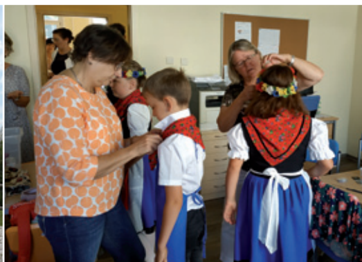
Zdrasćenje šulerjow w Bošecach za jubilejny program 125. lět Bošecanska šula