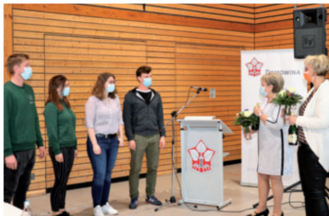
W lěće 2021 přistupi młodžinski klub Pančicy-Kukow k župje “Michał Hórnik”