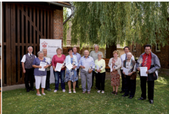
Pócesćenje dlujkolětnych člonkow Domowiny w Grožišću

W župomaj "Michał Hórnik" kaž tež "Jan Arnošt Smoler" su so rozmołwy mnohich dalšich serbskich zarjadowanjow dla ze zastupjerjemi serbskich gremijow na kromje druhich zarjadowanjow (lěto župow a Lěto Zejlerja a Kocor, džeń wotewrjenych duri, atd.) wjedli. W přichodže je přeče, z konkretnymi wobsahami ze zastupjerjemi po potrebjce do rozmołwy přič.