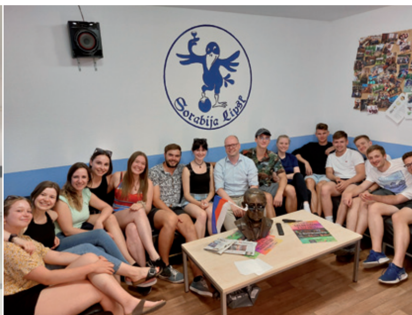
Zetkanje předsydy Domowiny ze studentkami a studentami “Sorabije Lipsk”: stajna wuměna ze studentami je Domowinje ważna