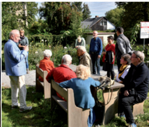
Kubtanska jězba župy “Jan Arnošt Smoler” na slědach K. A. Kocora 2022: tu při šulskim muzeju w Stróži, kiž jeho mjeno nosy