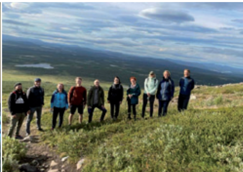
Kubłanska jěžba do Šwedskeho Tornedalen