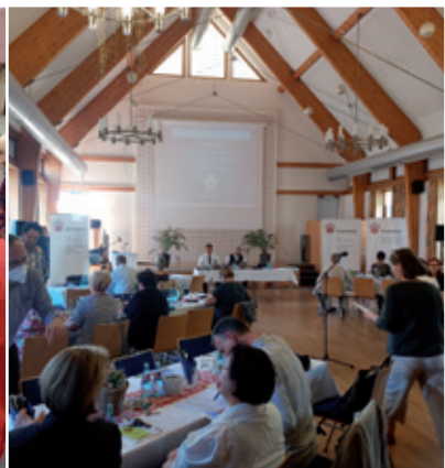
Hłowna zhromadźizna župy Dolna Łužyca w Rogowje w lěće 2022