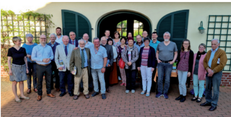
Wopyt delegacije z Wendlanda we Wojerecach