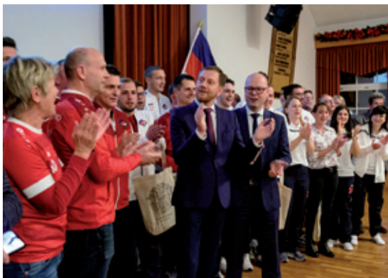
Džakne zarjadowanje wobdžělnikow na Europeadže 2022 w Slepom dnja 18.11.2022