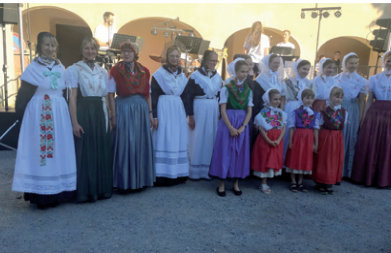
W Bukecach załožı so 2022 składnostnje 800-lětnego jubileja přěnjeho naspomnjenja Bukec drastowa skupina ewangelskich Serbow Budyskeho kraja

Předsedař Spěchowańskego towaristwa za serbsku rěc w cerkwi jo rownocasnje čłonk prezidija Domowiny a se pšepšosyjo na pósejženja předsedařstwa.