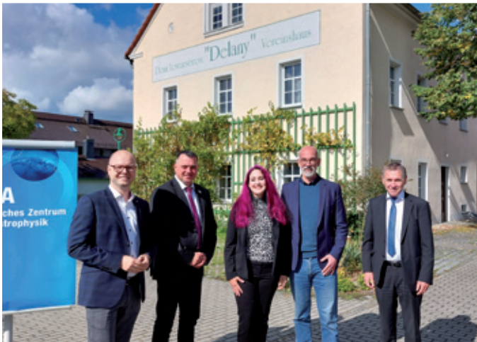
Domowina podpěra wulkoprojekt „Němski centrum za astrofyziku“ (DZA) jako slědženišćo

Domowina wobkedźbuje kritisce dalše wuwice nastupajo doskóncneho składa za atomowe wótpadki. Zarjad wobkedźbuje dalše wuwice k temje, koordinuje trěbne stejišća a wothłosowanja ze serbskeho wida. Předsyda Domowiny bě z jednaćelom Sakskeho zjednoćenstwa městow a gmejnow (SSG) w rozmołwje. Po potrebjce ma so zhromadne stejišćo wudžělać. Na komunalnej runinje wothłosuje so Domowina stajnje ze zastupjerjemi gmejnow po potrebjce a zabjerje kritiske stejišćo k tutej temje.