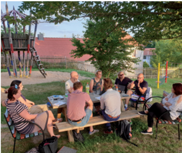
Zetkanje předsydy Domowiny a referentki Domowiny za kubtanje a dorost z předsydstwom Serbskeho šulskeho towarstwa: Fachowa wuměna z bazu je za džěławosć třěšneho zwjazka jara wažna

3.5. Domowina podpěrujo zwopšawdnjenje a dalepisanje Bramborskego krajnego plana za zmócnjenje dolnoserbskeje rěcy a drugo plan napšawow Sakskego statneho kněžařstwa k pózbužowanju a k wóžywjenu wužywanja serbskeje rěcy.