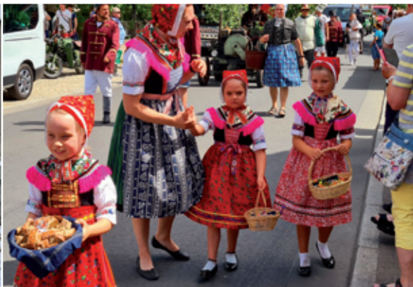
Wulki swjedženski čah składnostnje 750 lět Slepó a 9. mjaznarodneho festiwala dudakow