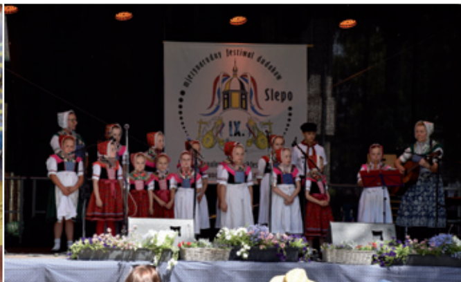
Wustup džěčaceho ansambla Slepó z. t. składnostnje 750 lět Slepó a 9. mjaznarodneho festiwala dudakow