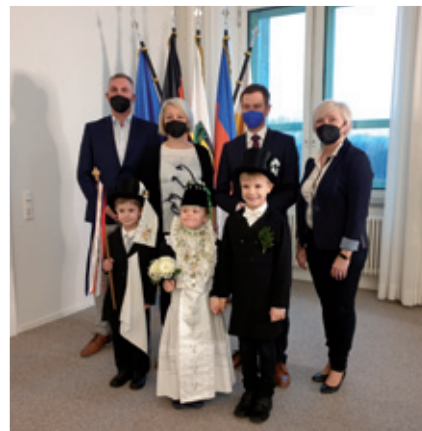
Ptači kwas w Statnej kencliji w Drježdžanach z Budyskej serbskej pěstowarnju „Jan Radyserb-Wjela“