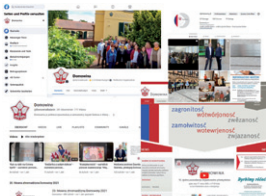
Domowina w socialnych mediach