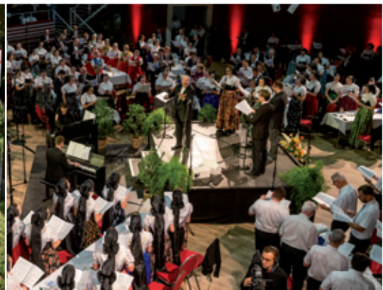
Serbski spěwanski swjedžeń - wjeršk “Lěta Zejlerja a Kocora” - dnja 29. winowca 2022 w Budyskej Krónje z něhdže 350 sobuskutkowacymi pod wumělskim nawodom Friedemanna Böhme