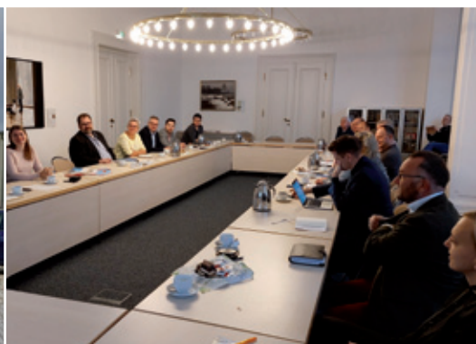
Fachowa konferenca wjesnjanostkow a wjesnjanostow serbskeho sydlenkeho ruma Sakskeje w Budyšinje