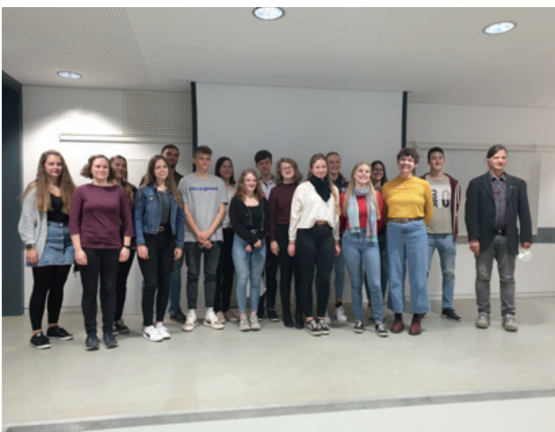
Studenća sorabistiki na wotewrjenskim zarjadowanju Instituta za sorabistiku w Lipsku

Dale je naležnosć wospjetnje tema w kwartalnych posedženjach z nawodami serbskich institucijow. W lěće 2022 je so wospjetnje wo wužadanjach rěčneho planowanja w serbskich institucijach diskutowało. Sama je so Domowina na puć podała, internu rěčnu politiku wudžětać, wo tym so tež dalše serbske institucije na posedženjach informowachu. Na tutym puću měli w přichodnych lětach pokročować.