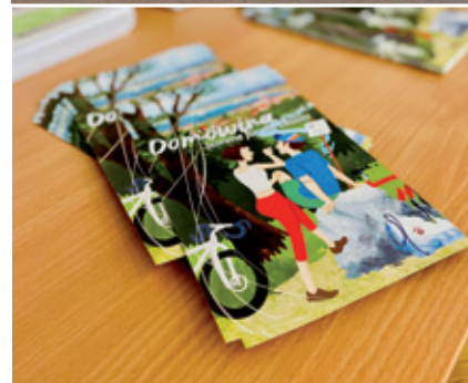
Nowy lětak Domowiny