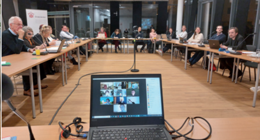
Posedźenje Zwjazkowego předsydstwa Domowiny kónc lěta 2022 – z časa pandemie stajnje w hybridnej formje