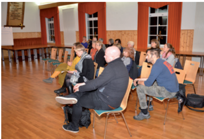
Župa Jakub Lorenc-Zalěski wuhotowa 2022 Serbski wječor pod temu "Wizije přichoda za Serbski kulturny centrum Slepo" jako srjedžišćo kulturneho žiwjenja