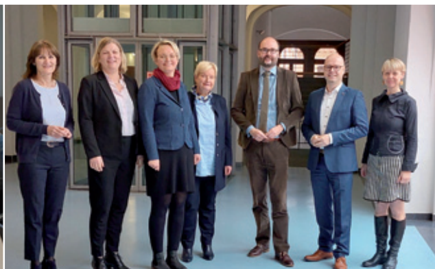
Serbska delegacija pola kultusoweho ministra Christiana Piwarza w Drježdžanach