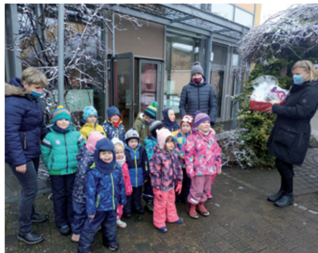
Domowina přepoda Radworskej pěstowarni pedagogiski material – jako podpěru za rěčne kubłanje kubłarjow a džěci

W Bramborskej se iniciěrowanje pódobnych procesow k nažěłanju informaciskego materiala teke komužijo. Drugi Krajny plan k zmócnjenju dolnoserbskeje rěcy z lěta 2022 pak wopšimjejo napšawu k wužěłanju takich materialijow (pšir. boka 66 a 67 pomjenjonego plana).