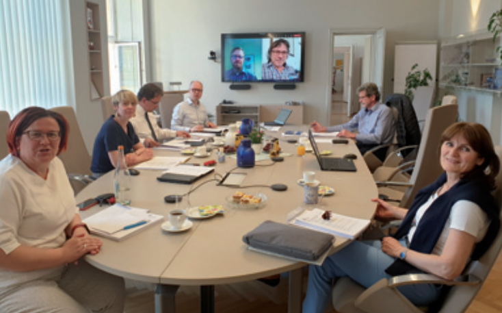
Tak schadźuje so prezidij Domowiny w běhu lěta hač do 12 króć, na městnje a digitalnje