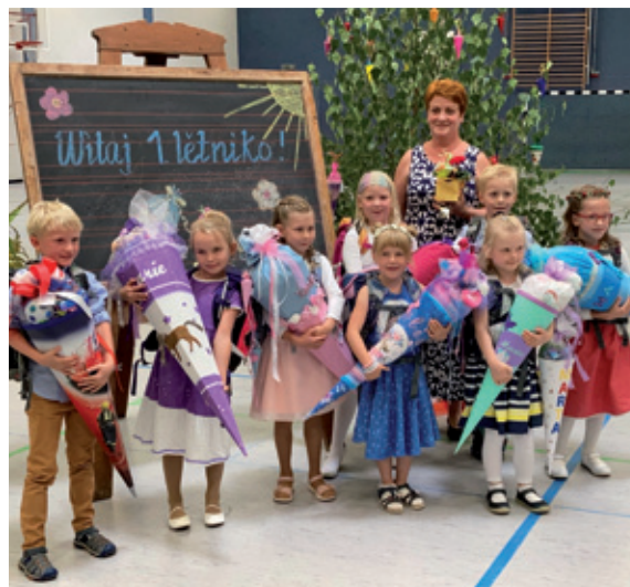
Druha serbska rjadownja na Radworskej zakładnej šuli při zastupje do šule w šulskim lěće 2021/2022 z wosom šulerjemi | foto: Katrin Suhech-Dźislawkowa

Z akcije „jo!zatebje“ su pšišli přédne impulse za masterski plan za rewitalizaciju dolnoserskeje rěcy. Modelowy projekt „Zorja“ a teke masterski plan stej w nosaštwje Domowina Niederlausitz Projekt GmbH. Gaž pšišo k praktiskej fazy, pódpěruju Rěcny centrum WITAJ projekt „Zorja“. W měrcu