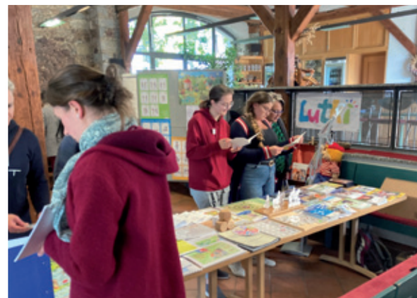
Zhromadna fachowa konferenca Serbskeho šulskeho towarstwa a Domowiny, dnja 13.10.2022 w Smochćicach k temje: “Wužiwanje serbskeje rěče při kubtanju w pěstowarnjach”