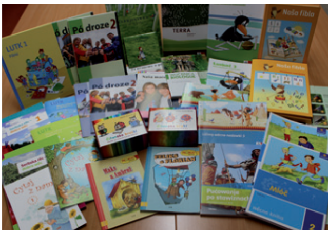
Wučbne srědki RCW