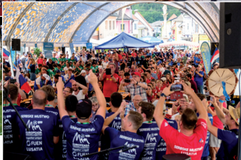
Europeada 2022 – kulturny džeń a polfinale