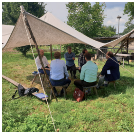
Rozmołwa ze zastupjerjemi Serbskeho instituta nastupajo móžne projekty strukturneje změny w Hornjej Łužicy: Domowina je ze spočatka procesa wšitkich serbskich akterow integrowała

Ako facit turněra musy se zwěsćić, až jo mustwo ze swójimi 10 grajarjemi z Dolneje a 14 grajarjemi z Górneje Łužyce napšawdu k mócnej jednotce gromadu zrosło. Muske su toś tu zgromadnosť tek pó zejgratem połfinalu jasnje pokazali. Pógonjenje jo pśi tom