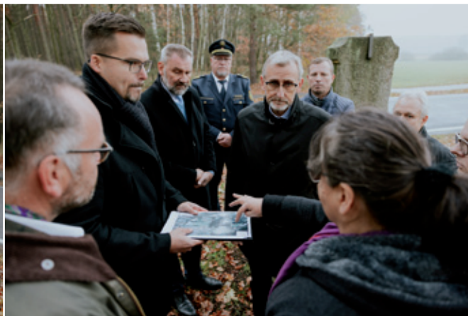
Rjad wonječesčenjow křižow je wosebje wobydlerjow a wobsedžerjow rozhorito. Minister Schuster informowaše so na městnje wo stawje přepytowanja