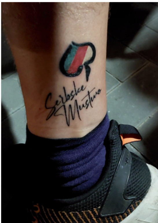
Europeada zamóže tež serbsku identitu skručić. Wo tym swědči tattoo hrajerja z Delnjeje Łužicy

pšecej była pódpěra serbskich fanow na městnje a w domowni, rowno tak ako widejowe póstrowjenja z politiky a sporta.