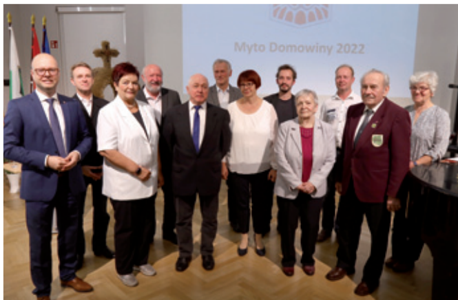
Lawreaća „Myta Domowiny“ a „Čestneho znamješka“ Domowiny lěta 2022

Wuběrk za nastupnosći strukturneje změny, góspodařstwo a infrastrukturu pówołajo referent za infrastrukturelne nastupnosći. Wuběrk jo se 9 razow zmakeař. Wuběrk jo ze zastojnstwom Domowiny pšewjadř konferencu k wuměnje serbskich institucijow wó strategiskem póstupowanju Serbow w ramiku změny strukturow w Sakskej. Dalej jo wužětař kriterije a koncepciju za zjawne myto za pšedewzešarjow (glej ž. sm. 6.1.). Pšedsedař wuběrka jo se wobžěliř mimo tego aktiwne w nadawku Domowiny na konferency BTU w Chóšebuzu k temje: “Wupołnjone žywjenje we Łužycy – serbske perspektiwu w změnje strukturow”.