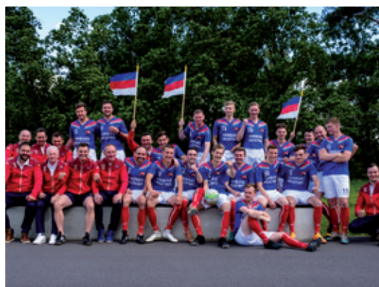
Skupinski wobraz nominowaneho SERBSKEHO MUSTWA, Slepo, meja 2022