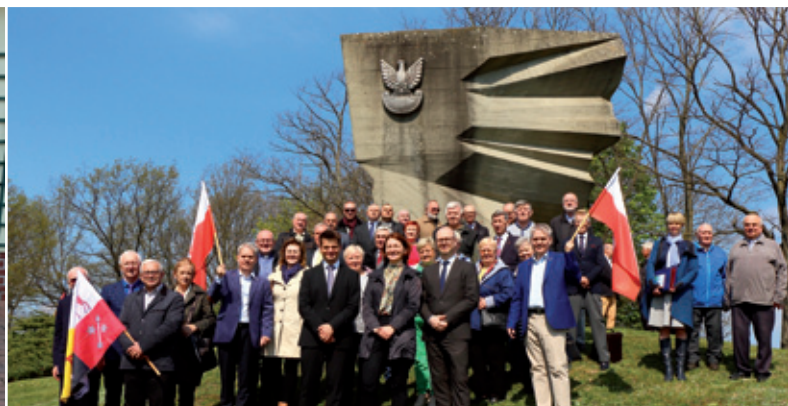
Spominanje na padnjenych pólskich wojakow w Chrósćicach dnja 28.04.2022