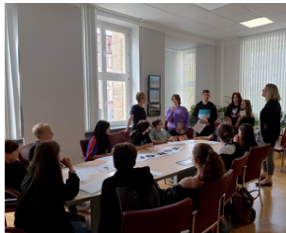
Woglěd 8. lětnika Dolnoserbskego gymnazija w serbskich institucijach w Budyšynje pola Domowiny

W Dolnej Łužycy starataj se młožinski koordinatori a zagroniti za młožinske žěto w měsće Chóšebuz w nadawku Župy Dolna Łužyca wó młožinske žěto w běgu lěta.