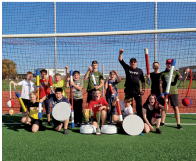
Šulske socialne džěto na Wyšej šuli „Dr. Marja Grólmusec“ w Slepom: jugger-sport jako popołdniši a prózdniški poskitk

Na zakładže noweho šulskeho zakonja w Sakskej ma so šulske socialne džěto na kóždej wyšej šuli ze 40 hodžinami wob tydžeń zawěšćić. Dokelž pak na šulskich stejščach w Radworju, Ralbicach, Worklecach a w Budyšinje koleginy džětowe městna jenož z 30 hodžinami wobsadžeja, dopjelnja so zbytnje 10 hodžiny 4 króč wot koleginy, kotraž 40 hodžin džěta. Wot nalěča 2021 sem pak skutkowaše tuta koleginja we Worklecach a w Ralbicach sama, dokelž běštej koleginje hač do oktobra 2022 resp. februara 2023 w staršiskim času.