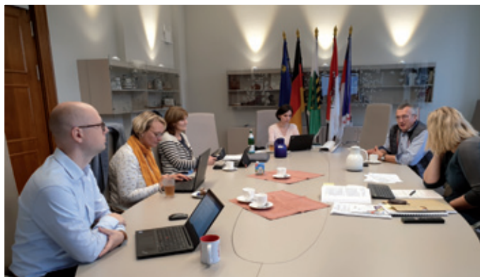
Wuměna w přihoće na posedženje wodženskeje skupiny “2plus” Sakskeho kultusoweho ministerstwa. Nimo Domowiny su Serbske šulske towarstwo, RCW a LaSuB wažni akterjo wodženskeje skupiny

Wažne při tym budže, wuslědki ze zaběžaneje ewaluacije 2plus koncepta, kiž je 2022 startowała, wobkedžbować, přenje wuslědki wočaknyć a na nje nawjazać.