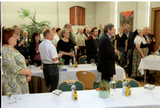
Trójna slawa lawreatam „Myta Domowiny“ a „Čestneho znamješka“

Wuběrk za nutřkownu demokratiju a serbsku ciwilnu towarišnosć zwola referentka za naležnosće třěšneho zwjazka. Wuběrk je so pječ króć w Budyšinje a hybridnje zetkař. Wuběrkej přištušeja 5 čłonow. Septemberske wuradžowanje wotmě so jako zhromadne posedženje z wuběrkom za zjawnostne a wukrajne džěło. Hłowna tema bě, kak móhli dorost za serbske institucije zdobywař a poskitki serbskich džěłowych městnow lěpje šěrić. Tuta tema wuběrk dale zaběra.