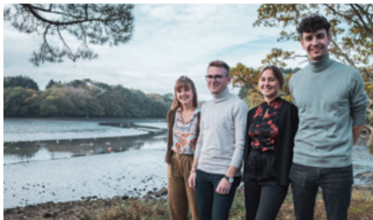
Domowina delegowa młodžinske towarstwo PAWK na jutrowny seminar MENS, kotryž přewjedže so w aprylu 2022 w Danskej namjezej kónčinje

W lěće 2021 knježeše hišće pandemija, štož so – kaž hižo w lěće 2020 – sylnje na džěto z wukrajom wuskutkowaše. Tak bštej na př. jenož jedna kulturna wuměna a jedne delegowanje. Bolostny začuwachmy wupad Europeady, Folklorneho festiwalu a delegowanja Serbskeje rejomanskeje skupiny Smjerdžaca na Folkloriadu w Ruskej.