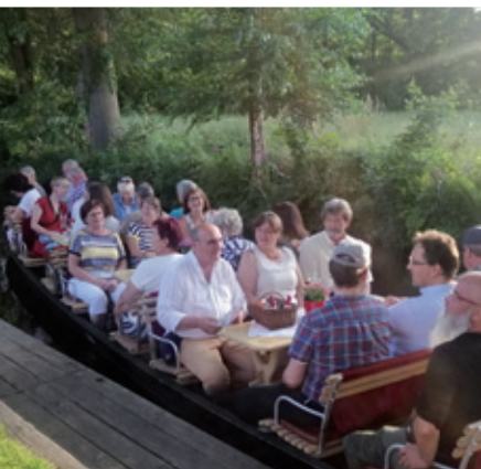
Wulět župnych předsydstwow na “bajowe čolmikowanje” do Blótow

Regionalne rěčnicy wothłosowachu tak terminy a wuměny skerje krótkodobnje abo dyrbjachu je přewěnować abo wotprajić. Hladajo na Lěto Zejlerja a Kocora 2022 su so zdžěla zarjadowanja mjez sobu zwjazali (hlej dž. sm. 5.4).