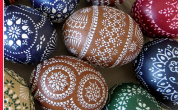
Dobyčerske kolekcije wubědźowanja wo najrjeńše jutrowne jejko 2022