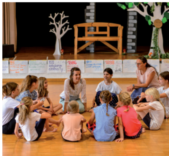
Rěčna žěłarnja w proznicach w Chóšebuzu - slědne wótgłosowanja za žiwadłowe graše