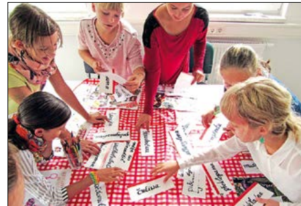
Na holcim dnju w Smjerdžacej