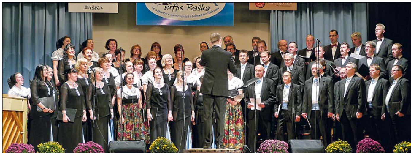
Radworski ch3r „Meja“ poda so spočatk oktobra do Bařki w Čěskej republice. Tam bu před runje 30 l3tami partnerske zr3ćenje mjez ludowym ch3rom z Bařki a Radworskej „Meju“ podpisane. Z toho 3asa hajitej ch3roj runje tak kař jednotliwi sp3warjo přečelske styki. Sobotu, 4. oktobra, wuhotowachu w Bařce zhromadny koncert w třeoh dź3lach: wustup Bařčanow, wustup Radworčanow a wjacore zhromadne sp3wy wobeju ch3row (foto). Swjedźenske zarjadowanje dožiwi wjac hač 100 wopytowarjow.