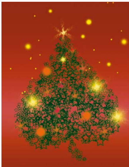
grafika: Iris Brankačkowa

Lube člonki a lubi člonjo Domowiny, župow, towarstwow a Domowinskih skupin, lubi přečeljo a partnerjo našeje narodneje organizacije, Wam wšěm přejemaj wjesole hody a měrne swjate dny w kruhu Wašich lubych. Do noweho lěta přejemaj Wam zbožo, krutu strowotu a derjeměće. Džakujemaj so Wam w mjenje zwjazkoweho předsydstwa a přistajenych Domowiny wutrobne za wšě Waše prócowanja na dobro serbskeho ludu a wjeselimaj so na dalše wuspěšne zhromadne džělo.