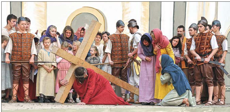
Jězus a plakace žónske z Jerusalema