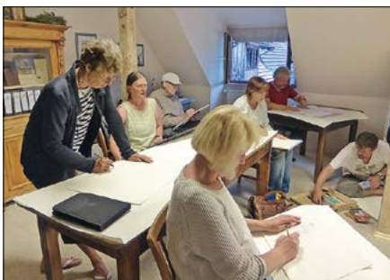
Na lětušej molerskej džěłarničce Spěchowanskeho kruha za serbsku ludowu kulturu w juniju w Čornym Chołmcu