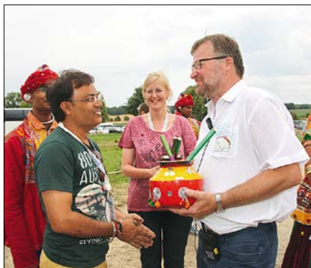
Impresije z XI. mjezynarodneho folklorneho festiwalu „Łužica“