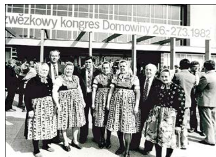
Z chroniki Domowinskeje skupiny Trjebinjce