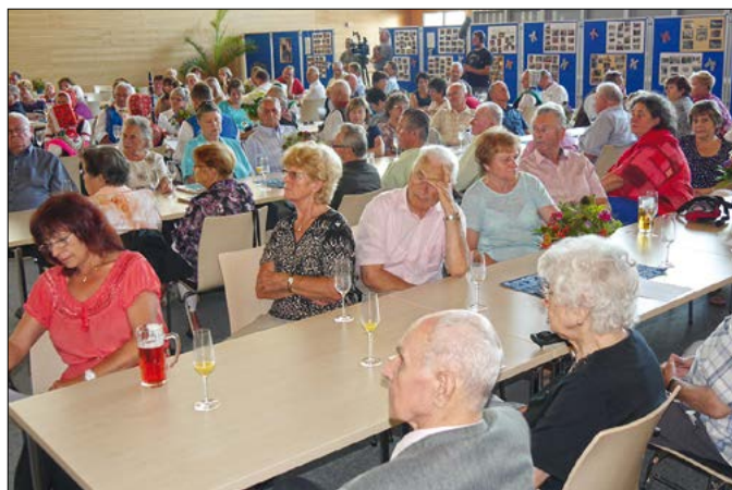
Pohlad do polnje wobsadźeneho towarstwoweho doma w Trjebinjce, hdžež swjećajicu dnja 29. awgusta 70-lětnje wobstaće Domowinskeje skupiny.

27. meje 2010 dóstachmy kluče za Šusterec dwór, kiž bu 2008/09 z wjesneho dźěla Zagóru wotwarjeny a w zelenym srjedzišću Trjebina zaso natwarjeny. Z toho dnja je tam