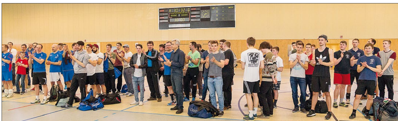
Impresije z lětušeho 35. volleyballowego turněra wo pokal Domowiny dnja 1. apryla w Budyšinje