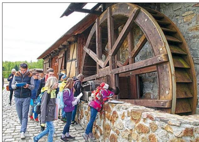
Zajimawe dožiwjenja a dohlady skićeše projektowy džen župy „Jan Arnošt Smoler“ 19 šulerjam ze zakładnych šulow w Rakecach, we Wulkej Dubrawje a w Barće dnja 10. meje w Krabatowym mlynje w Čornym Chołmca.