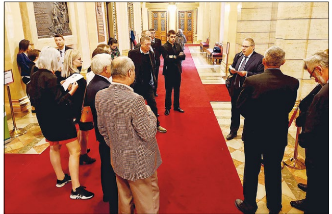
Wobželnyki FUEN-seminara su woglědali do parlamenta a zgónili zajmne fakty wó mjeńšynowej politice we Hungorskej.

šulstwa mjeńšynow. By se žycyl, aby my we Dolnej Łužycy teke mógał našu situaciju do takego směra změniš. We wósobinskich rozgronach z ceptarjami som zgónił, až Słowaki su spokojom z mjeńšynowuju politiku Viktora Orbána, ale wóni wiže teke dosć problemow, což nastupa situaciju Sinty a Roma we Hungorskej. Na seminarje su se wšykne wobželnyki mógałi zeznawaš z problemami drugih mjeńšynow a nawězaš wósobinske kontakty. Za mnjo jo wobželjenje na seminarje wjelgin rědne do-