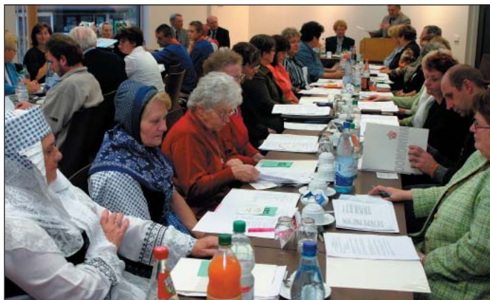
Dnja 16. nowembra wotmě so we Wochozach hłowna zhromadźizna župy Běta Woda/Niska.

Klětu podpěruje župa serbske swjedenje na Slepjanskimaj šulomaj a zesylni kontakty do Pólskeje. W ramiku 35-lětneho wobstaća Slepjanskeho folklorneho ansambla organizuje so znowa zetkanje dudakow. Tež wjesny žnjenski