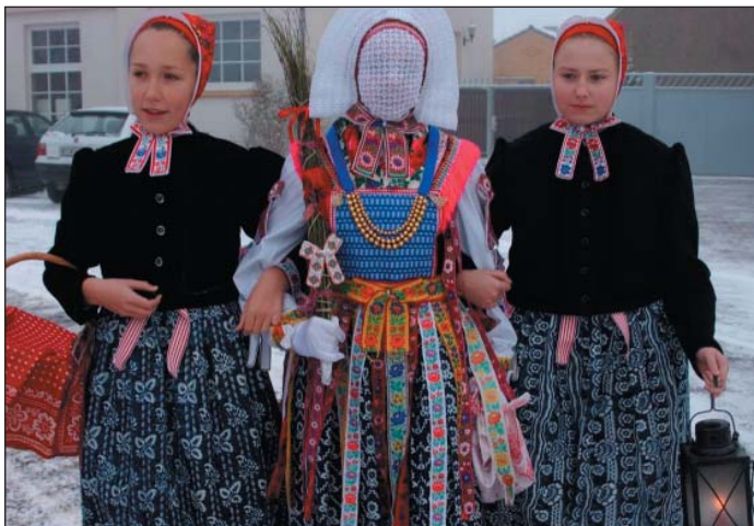
Slepjanske džěcatko je po puću.