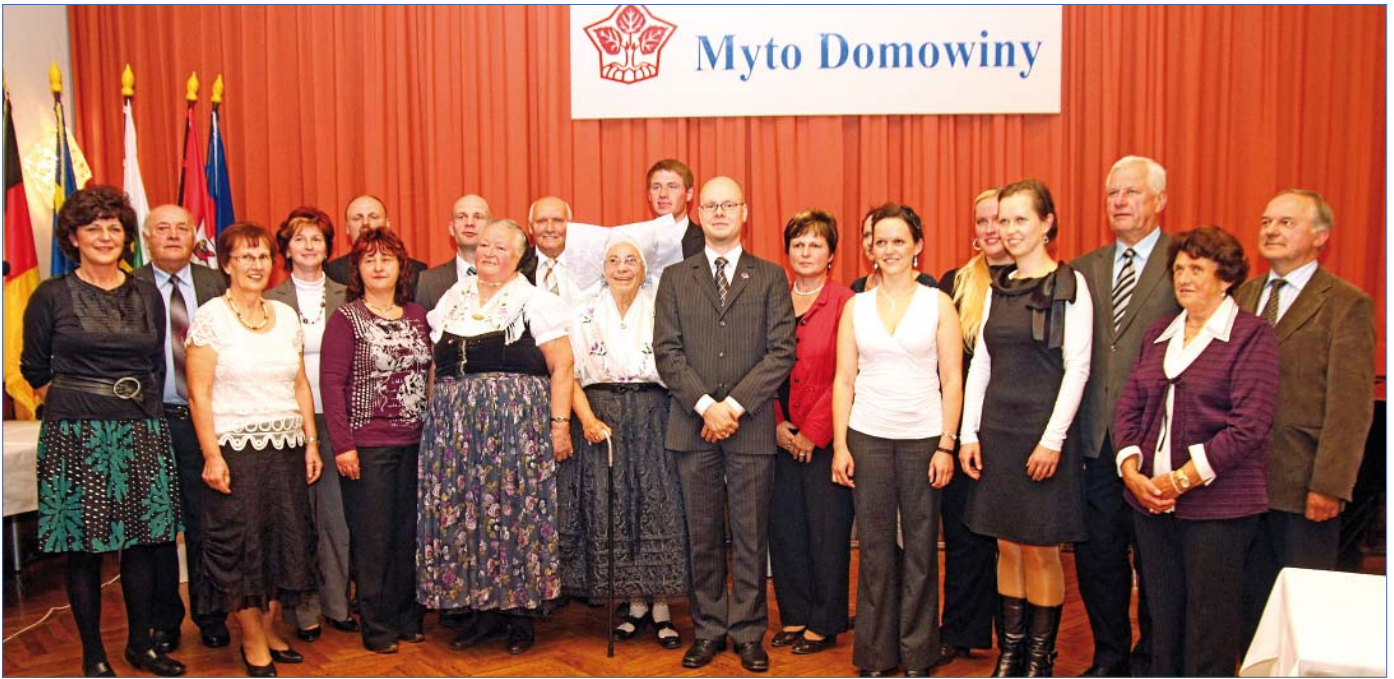
Lětuši lawreaća Myta Domowiny, Myta Domowiny za dorost a Čestneho znamješka Domowiny na wuznamjenjenskim zarjadowanju dnja 14. oktobra w Budyskim Serbskim domje