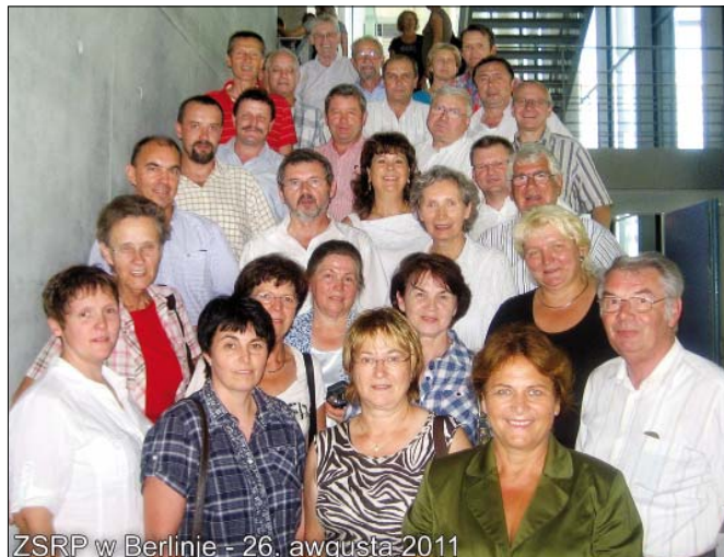
ZSRP w Berlinie - 26. awgusta-2011

Dnja 01.10.2011 přewjedzechmy w Lejnje „Bal serbskich předewzaćelow“. Přeprosychmy sej Serbski ludowy ansambl z Budyšina (SLA). Profesionalni wumělcy běchu jara derje přihotowani a poskićichu nam