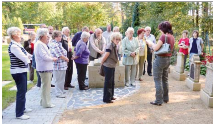
W Rownom wobhladachu sej wobnowjene serbske narowne kamjenje