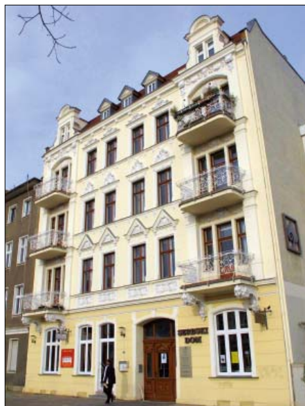
Serbski dom w Chóšebuzu na Augusta Bebelowej droze 82

Chtož pšizo do Serbskego domu w Chóšebuzu, ten njamóžo jano woglědaš do LODKI, k Domowinje, do Dolnosersbskeje biblioteki a do Chóšebuskeje wótnožki Załožby za serbski lud a Serbskego instituta, ale móžo se tudy w klubowni