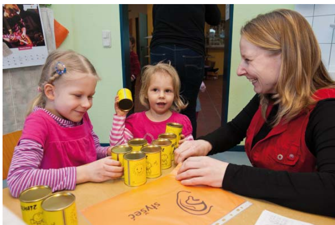
Na lětušej swójbnej schadźowance w Chrósćicach

Njedzeli, 26.02.2012, přeprošychu Domowinska župa „Michał Hórnik“, Rěčny centrum WITAJ a Serbski ludowy ansambl wšitke džěci, jich staršich, džědow a wowki na schadźowanku swójbow do Chróšćanskeje „Jednoty“. Předewšěm serbscy starši z pěstowarskimi džěćimi poskitk we wulkej ličbe wužachu, tak