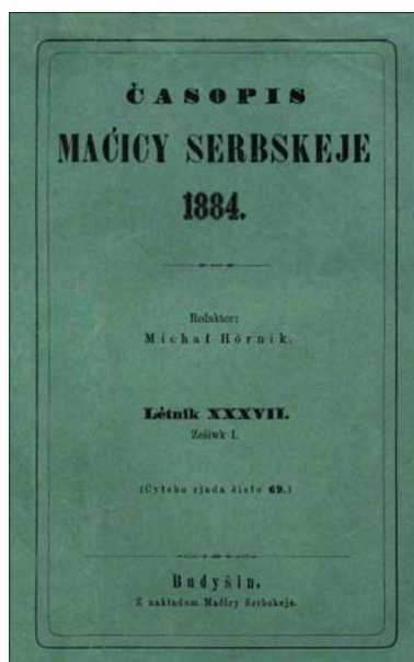
Wot lěta 1848 hač do lěta 1937 wuchadžeše Časopis Maćicy Serbskeje

luda, ale zdonk a jědro luda su te, kótarjež jano ze žěłom swójeje ruki a głowy se žywj, to su burja, žělašerje, rucnikarje a pšekupce.“