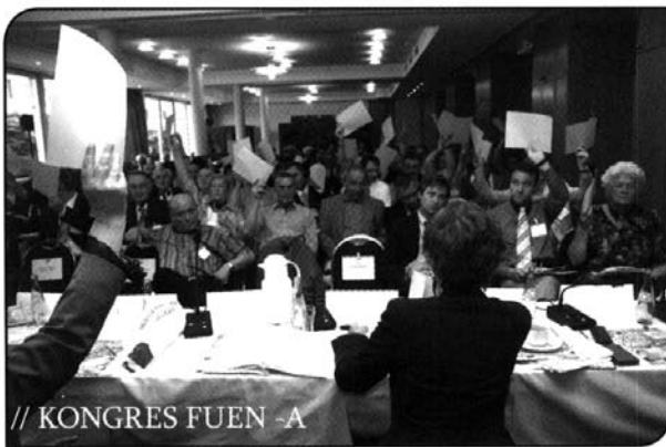
// KONGRES FUEN - A

Po dobro poiskanom otvaranju se je publika nažalost dijelomično zgubila. Svejedno je nudila konferencija dosta mogućnosti za diskusiju. Sve nazočne delegacije su imale šansu predstaviti aspekte problematike u svoji konkretni slučaj. Predstavljeni problemi su dijelomično bili slični, ali na drugu stranu i jako različiti. Kod nekih manjin odvisi školstvo od privatnih inicijativov, druge imaju prilično dobri obrazbeni sistem.